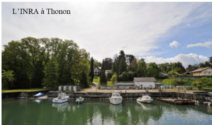
L'INRA à Thonon