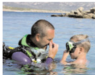
Une patience infinie avec les enfants.

Riche d'une expérience menée avec des enfants il y a quelques années comme accompagnateur de marche, de nage ou d'escalade, il ne lui a pas fallu beaucoup de temps pour découvrir une autre façon de plonger, celle qui lui