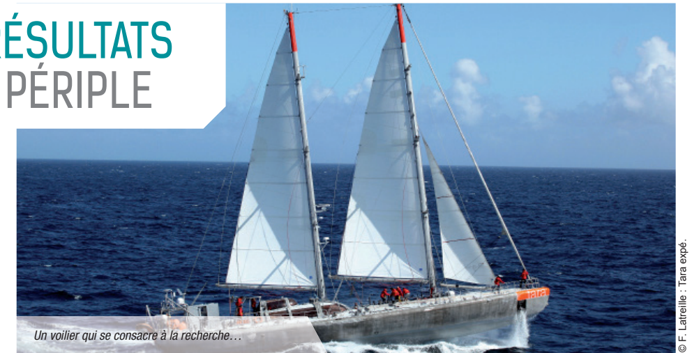
Un voilier qui se consacre à la recherche...

Résumer en quelques lignes le gigantisme des travaux réalisés et l'ensemble des résultats proposés est évidemment difficile et partial. Retenons tout de même (grâce au dossier de presse réalisé par le CNRS et sur lequel je m'appuie ici) que ces résultats proposent une cartographie détaillée de la biodiversité planctonique, explorent les interactions entre les micro-organismes observés et s'intéressent à l'impact des conditions environnementales sur cet écosystème microscopique. Pourquoi étudier le plancton ? Peut-être parce que ces êtres microscopiques qui dérivent dans les océans produisent la moitié de notre oxygène, agissent comme un puits de carbone, influencent et sont influencés par le climat et sont à la base des chaînes alimentaires océaniques qui nourrissent les poissons et les mammifères marins ! Ce que Tara aura déjà dévoilé c'est un changement radical de notre