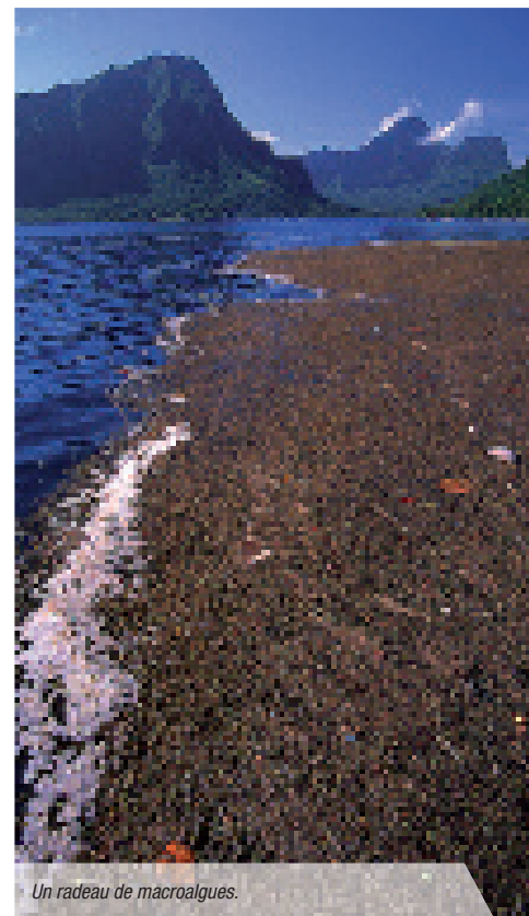
Un radeau de macroalgues.

secteurs en particulier dans le domaine de la nutraceutique, de la cosmétique et de l'agriculture. En Bretagne par exemple, la filière « algues » est maintenant bien développée avec une vingtaine d'entreprises dédiées à la valorisation et à la transformation des algues. Dans le domaine agricole, les algues sont utilisées à la fois comme engrais, fertilisants foliaires ou en nutrition animale. C'est ce secteur de la valorisation agricole qui a intéressé les industriels polynésiens lors du travail de recherche mené par Mayalen Zubia. Depuis des siècles, les paysans des régions côtières ont utilisé les algues échouées sur les rivages pour enrichir leur terre, principalement en Orient, mais également en France, en Irlande, au Royaume Uni et en Norvège. Les algues constituent un amendement de bonne qualité du fait de leur richesse en minéraux, en oligo-éléments, en vitamines, en polysaccharides et de la présence de polyphénols et d'hormones de croissance. Aujourd'hui, de nombreuses compagnies ont développé des engrais à base d'algues, soit pour les sols comme amendements organiques, soit en pulvérisation foliaire comme fertilisants liquides. Les principales algues utilisées sont les grandes algues brunes, et notamment les algues brunes Sargassum et Turbinaria dans de nombreux pays tropicaux (Bangladesh, Brésil, Égypte,