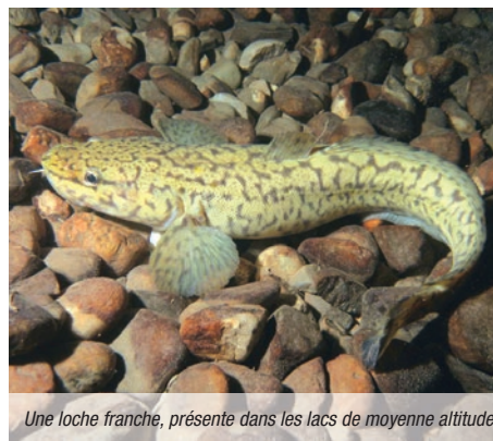
Une loche franche, présente dans les lacs de moyenne altitude.

Pour pallier les connaissances trop faibles en biologie, l'idée est de fabriquer des « ressources » pour les plongeurs (guides de palanquée mais pas que) sous la forme de nouveaux diaporamas types et vidéos sur la faune et flore lacustres ou encore sur le