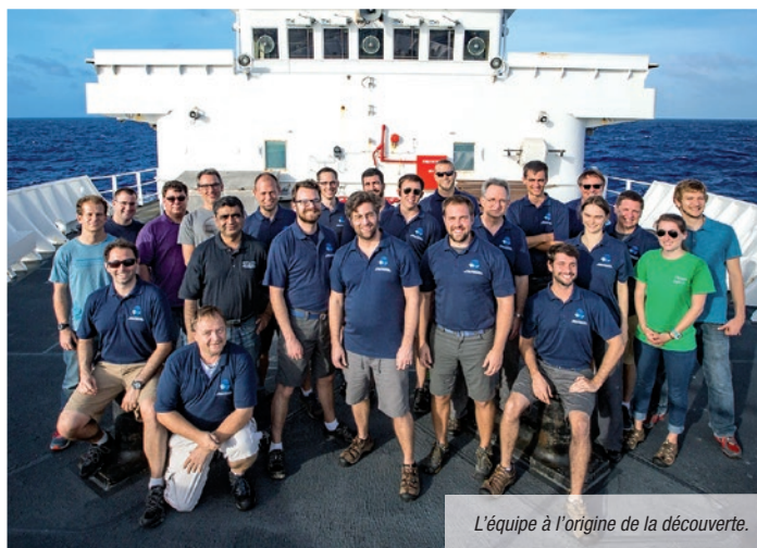
L'équipe à l'origine de la découverte.

Les nodules polymétalliques permettent donc à des éponges de s'ancrer et de vivre par grand fond. Quand elles meurent, elles persistent sous la forme d'une tige dressée, permettant à des petits poulpes de s'y accrocher, de pondre, de ventiler et de veiller sur leurs progénitures. Dans le froid et l'obscurité des abysses, un petit fantôme vit, se reproduit et meurt. L'exploitation minière des nodules polymétalliques serait, on l'a compris, catastrophique pour notre petit fantôme des abysses. On le sait d'autant plus qu'une expérience a été menée il y a quelques années visant à analyser l'impact sur la faune de la disparition des nodules, une conséquence logique de leur exploitation. L'expérience avait consisté à enterrer les nodules et de suivre pendant plusieurs années la faune des grands fonds : le constat fut sans appel puisque la biodiversité disparut pendant plusieurs années avant de revenir doucement mais surtout certains animaux avaient disparu à jamais, en particulier les éponges se fixant sur ces nodules! Puisse donc l'exploitation minière de cette ressource ne jamais arriver. ■