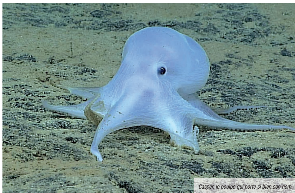
Casper, le poulpe qui porte si bien son nom.

Les fonds océaniques où on trouve les Casper sont toujours des zones riches en nodules polymétalliques, dont la quantité est en moyenne de 5 par m 2 mais pouvant atteindre le chiffre de 32 dans certaines zones. Ces nodules polymétalliques appelés aussi nodules de manganèse, sont des concrétions rocheuses reposant sur le lit océanique, formés de cercles concentriques d'hydroxydes de fer et de manganèse autour d'un noyau. De taille variable (microscopique